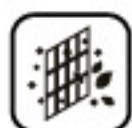
Filter s vysokou hustotou