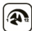
Vnútrotný ventilátor s 12 rýchlostami