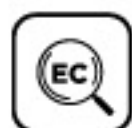
Detekcia nízkej hladiny chladiva