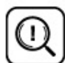
Automatická diagnostika poruchy