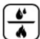
Ohrev vaničky kondenzátu