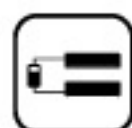
Kompatibilita s mono I multi