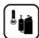
Chladenie pri nízkych vonkajších teplotách