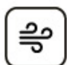
Jemné prúdenie vzduchu