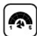
Vonkajší ventilátor s 5 rýchlostami