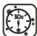
Okamžité chladenie / kúrenie