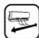
Horizontálne smerovanie vzduchu